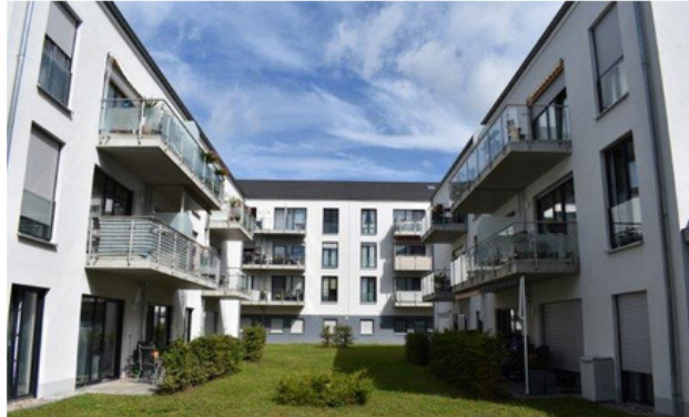
© mondial quartierfonds DII Objekt Velten

Während die Immobilienbranche von Krisengerüchten dominiert wird und das Risiko von Investitionen in Immobilienfonds hoch erscheint, beweist die mondial kapitalverwaltungsgesellschaft eindrucksvoll das Gegenteil: Die Renditen sind nicht nur stabil, sie wachsen kontinuierlich und übertreffen die Erwartungen.